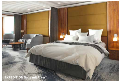
*Illustrierte Darstellung. Das endgültige Design kann abweichen.