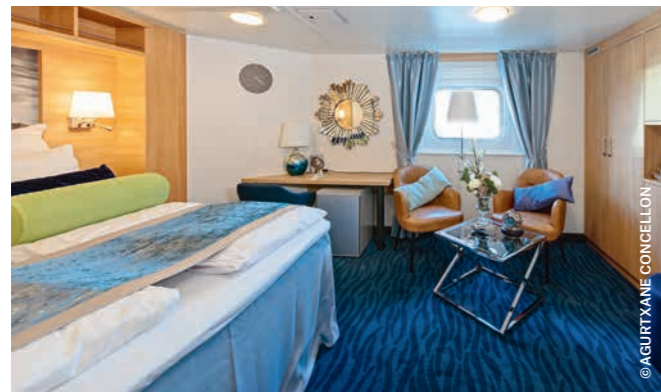
EXPEDITION Suite (Mini-Suite)