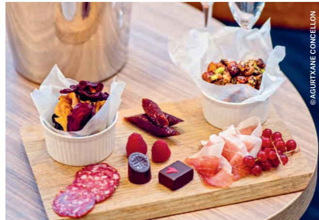
EXPEDITION Suite mit Willkommensgruß