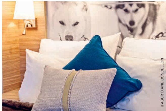
ARKTIS Außenkabine Superior