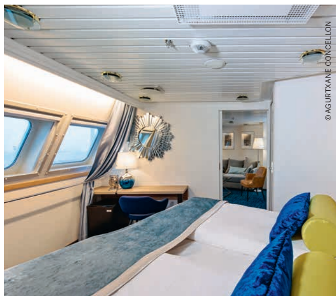
EXPEDITION Suite für bis zu vier Personen